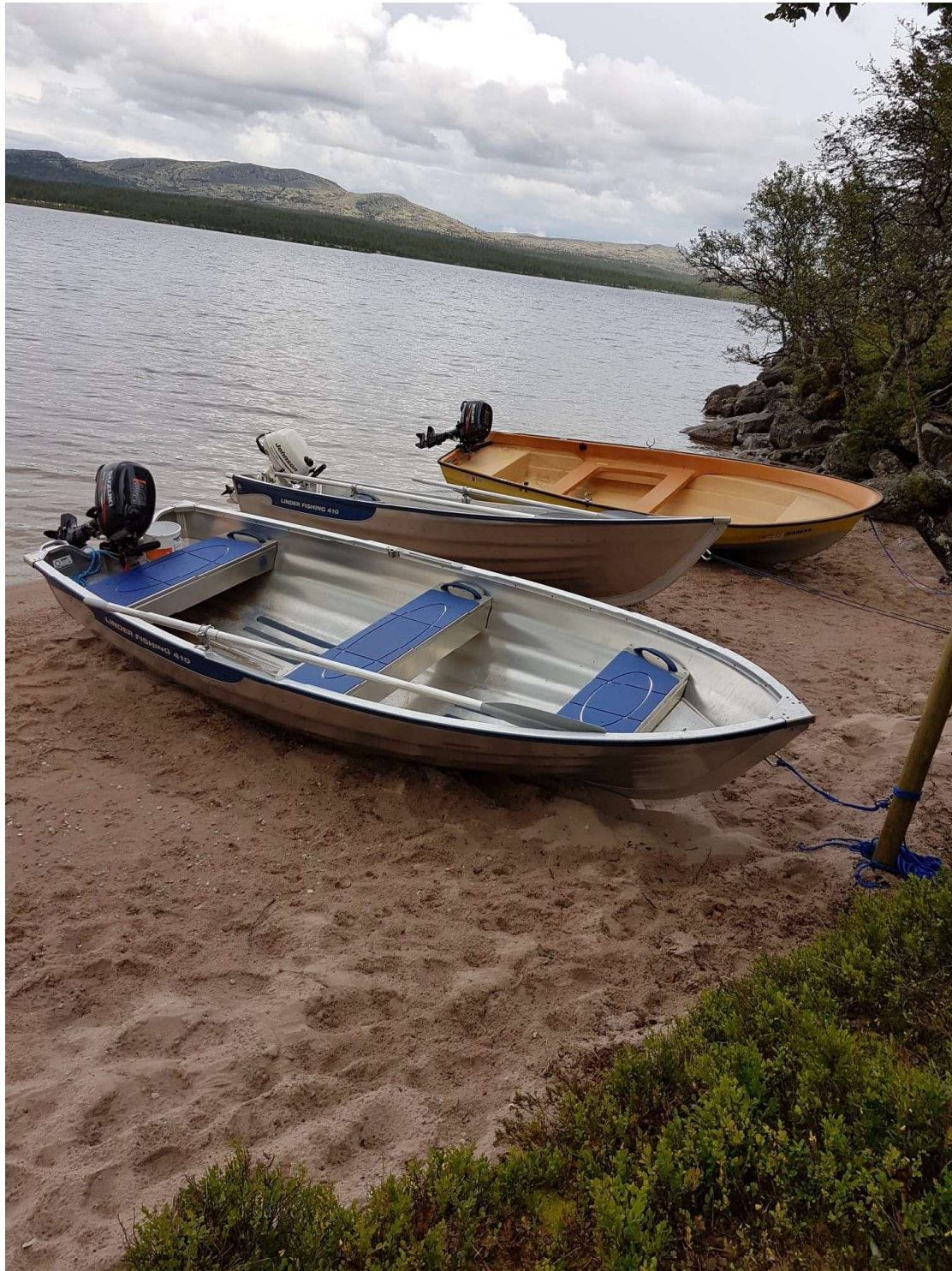
Sandstrand med båter til utleie