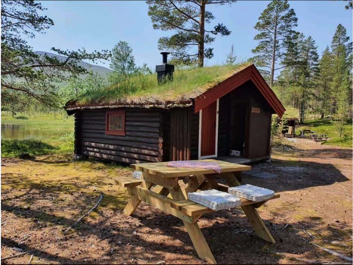
Nygårdsen og Glåmlibua (identiske buer)