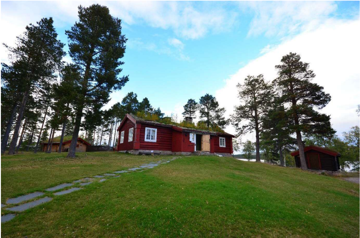
Fra venstre: sanitærbygg, Østerdalsstua og Stabburet